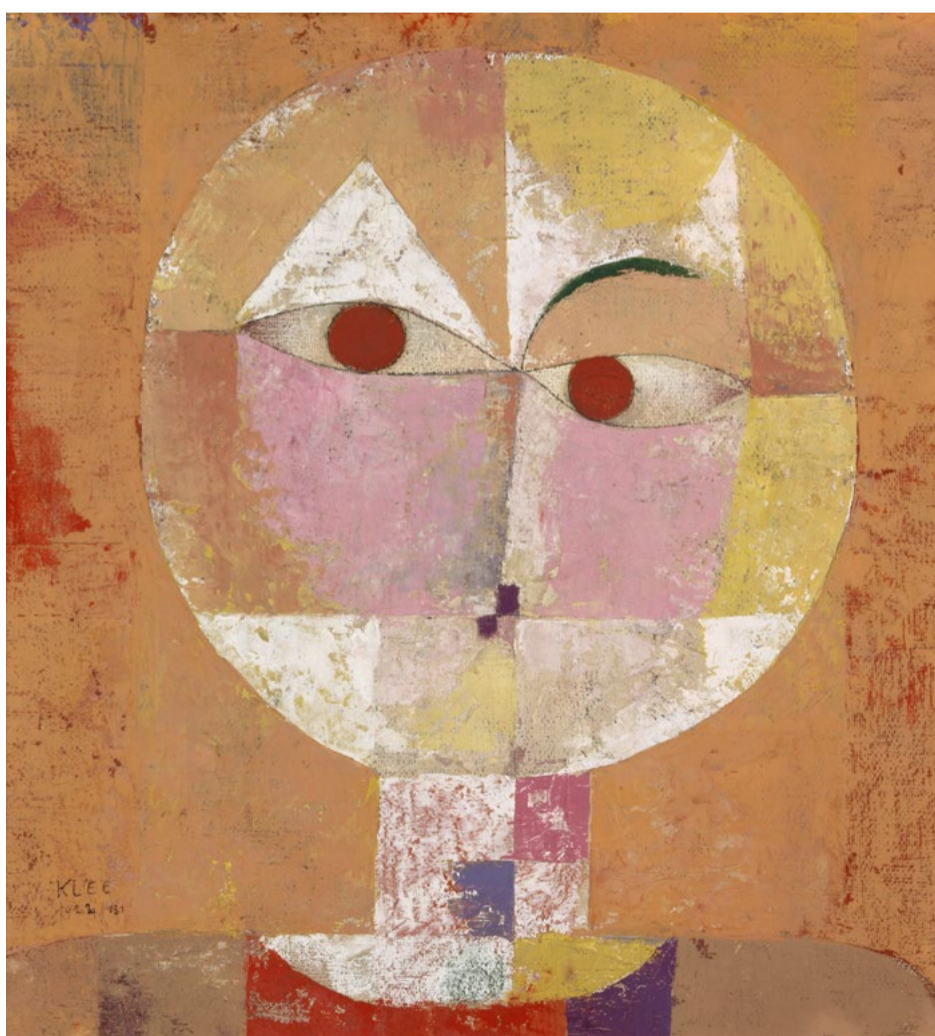
Paul KLEE, Senecio (bientôt vieillard), 1922 Huile sur fond de craie sur gaze sur carton, cadre jaune d'origine. 40,3 x 37,4 cm Kunstmuseum Basel Copyright: Bilddaten gemeinfrei - Kunstmuseum Basel Creditline: Kunstmuseum Basel, Ankauf Photo Credit: Martin P. Bühler

Der Künstler verwendet hauptsächlich warme Farben. Die Farben sind in Zonen organisiert, wodurch ein Gittereffekt im Gesicht entsteht, der die Unausgeglichenheit des Blicks betont.